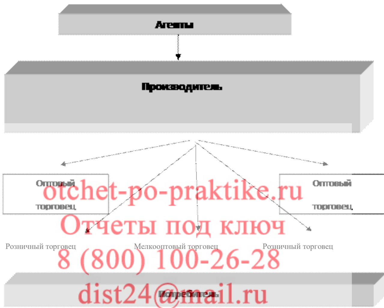
Рисунок 2 - Каналы распределения продукции ООО «Калязинский Хлебокомбинат»

б. Торговая сеть других населенных пунктов, при которой реализуется 25% продукции.